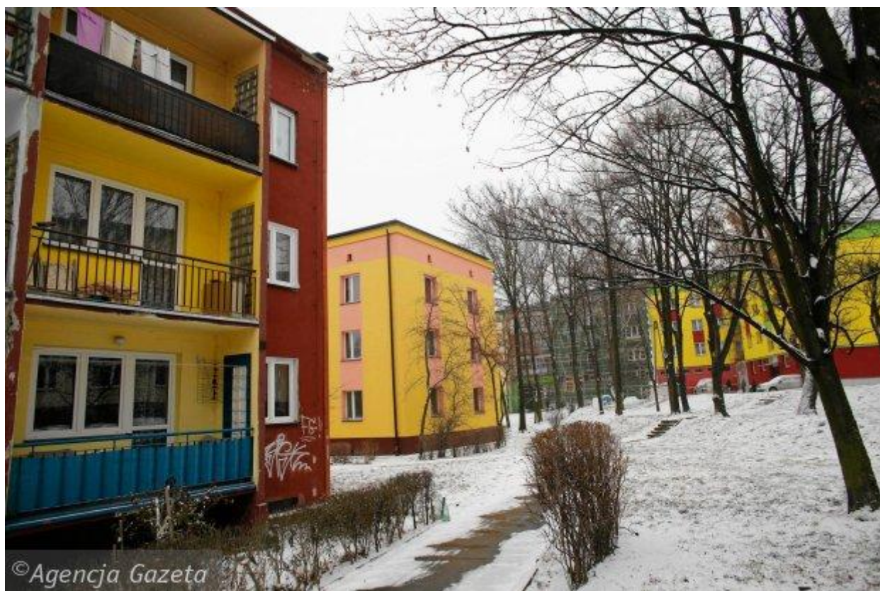
Kolorowe bloki w dąbrowskim Gołonogu

– Nasze narodowe poczucie estetyki ulega degradacji, a taki zabieg mógłby nieco powstrzymać tę tendencję – podkreślał urbanista.