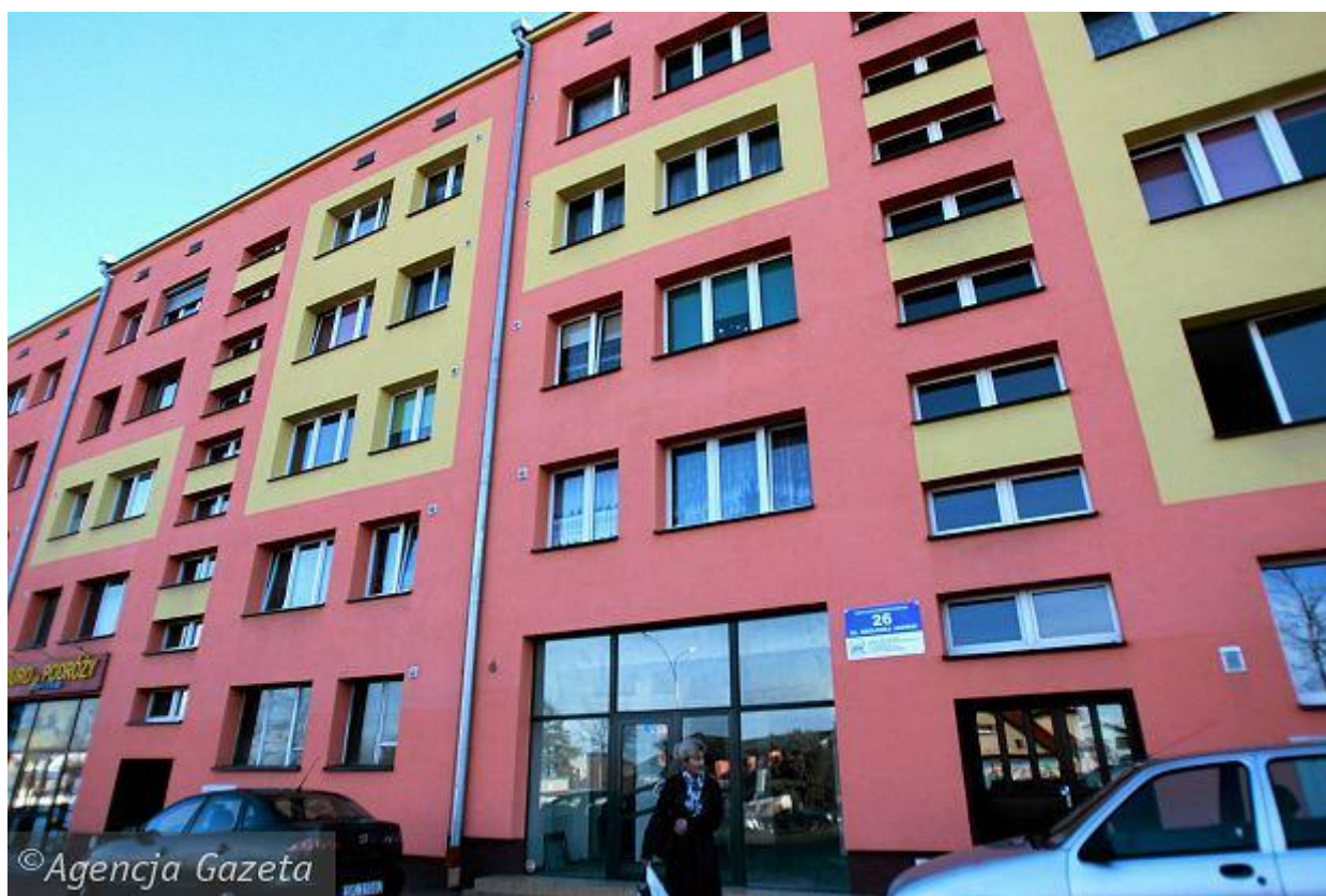
Blok przy ul. Królowej Jadwigi w Dąbrowie Górniczej

Osiedla bez spójnej kolorystyki. "Multikolor potęguje anarchię w przestrzeni" Można się o tym przekonać przejeżdżając choćby dwoma głównymi arteriami: ulicą Królowej Jadwigi i aleją Józefa Piłsudskiego. Pal licho, że w wielu przypadkach zestawiono kolory, które się ze sobą gryzą. Najgorsze, że żadne osiedle nie zachowuje jednej spójnej kolorystyki. Poszczególne bloki wyglądają, jakby projektanci ich kolorystyki byli brani z łapanki.