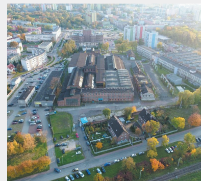
Ujęcie z drona nad torów kolejowych

Ideą koncepcji autorskiej było zdefiniowanie istoty oraz określenie możliwości wykorzystania potencjału, jaki oferują tereny po byłych zakładach Defum. Opracowanie miało na celu teoretyczne zdefiniowanie, określenie programu funkcjonalno-użytkowego, a następnie dokonanie wizualizacji autorskiej idei – opowieści o tym miejscu.