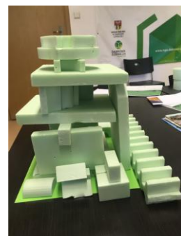
Ogrody na dachu PKZ