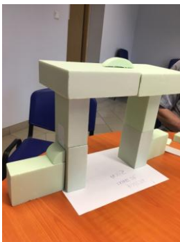
Brama monumentalna do Fabryki Pełnej Życia