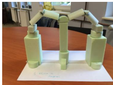
Brama industrialna do Fabryki Pełnej Życia