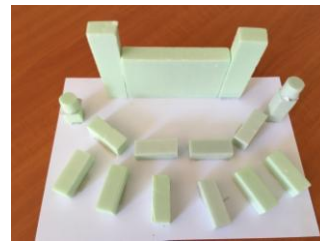
Amfiteatr w Fabryce