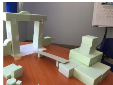
Most łączący Pałac Kultury Zagłębia z Fabryką Pełną Życia