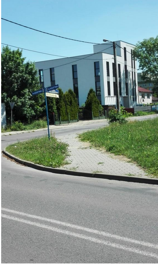
UL. KSIĘDZA GRZEGORZA AUGUSTYNIKA- chodnik wychodzący wprost na ulicę, brak przejść dla pieszych

Projekt współfinansowany ze środków Unii Europejskiej w ramach Programu Operacyjnego Pomoc Techniczna 2014-2020