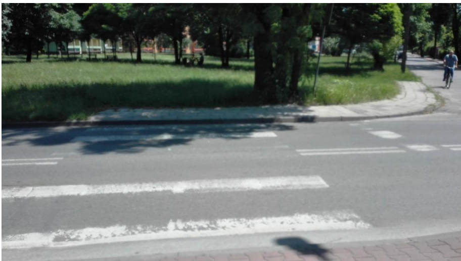
UL. KSIĘDZA GRZEGORZA AUGUSTYNIKA- chodnik, który się nagle urywa