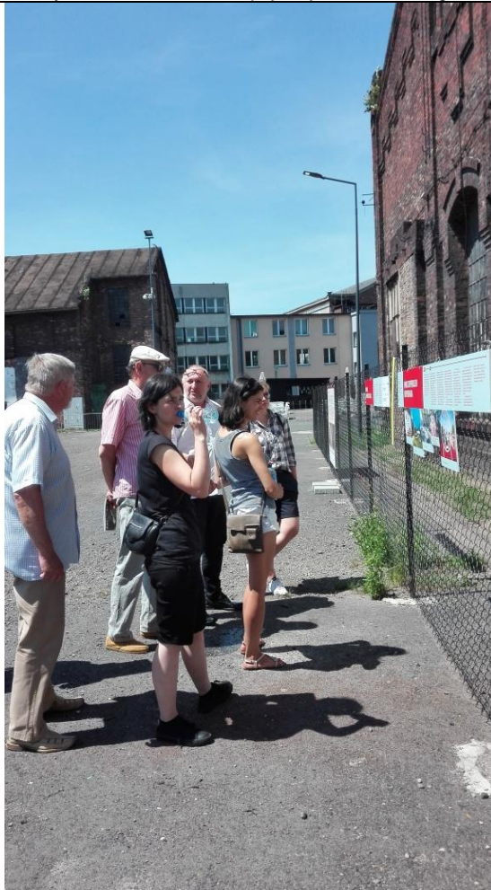
FABRYKA PEŁNA ŻYCIA, wystawa "Pomysł na rewitalizację"

Projekt współfinansowany ze środków Unii Europejskiej w ramach Programu Operacyjnego Pomoc Techniczna 2014-2020