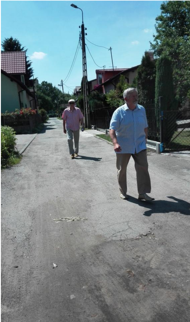
UL. PROSTA- brak chodnika, grupa przemieszcza się środkiem drogi

Charakterystyczne i podkreślane w tym miejscu przez badanych było nieco zaskakując i przyjemne przejście z przestrzeni miasta w przestrzeń podmiejską, początkowo z małymi zadbanymi domkami otoczonymi ładnymi „wiejskimi” ogródkami, a dalej z dużymi zabudowaniami willowymi.