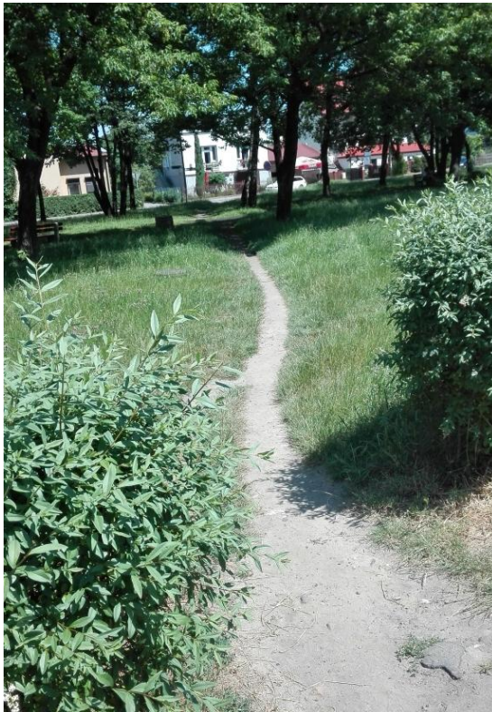
PLANTY IM. HARCMISTRZA STEFANA PIOTROWSKIEGO – jedna z bocznych ścieżek, która podczas deszczu zamienia się w błoto