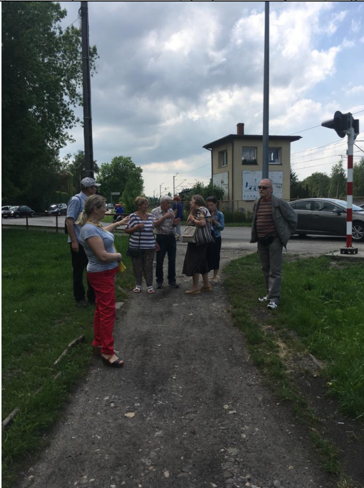
ŚCIEŻKA ŁĄCZĄCA UL. M. KONOPNICKIEJ Z UL. PONIATOWSKIEGO

Projekt współfinansowany ze środków Unii Europejskiej w ramach Programu Operacyjnego Pomoc Techniczna 2014-2020