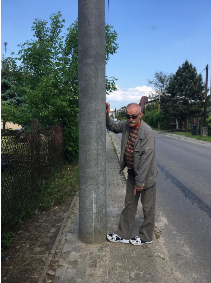
UL. J.I KRASZEWSKIEGO- latarnia na wąskim chodniku utrudniająca ruch pieszym

Projekt współfinansowany ze środków Unii Europejskiej w ramach Programu Operacyjnego Pomoc Techniczna 2014-2020