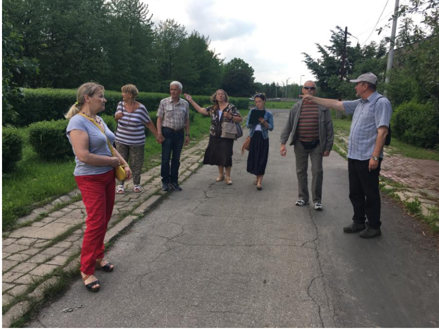
UL. J. PONIATOWSKIEGO I BIEGNĄCE WZDŁUŻ PLANTY IM. HARCMISTRZA S. PIOTROWSKIEGO

Projekt współfinansowany ze środków Unii Europejskiej w ramach Programu Operacyjnego Pomoc Techniczna 2014-2020