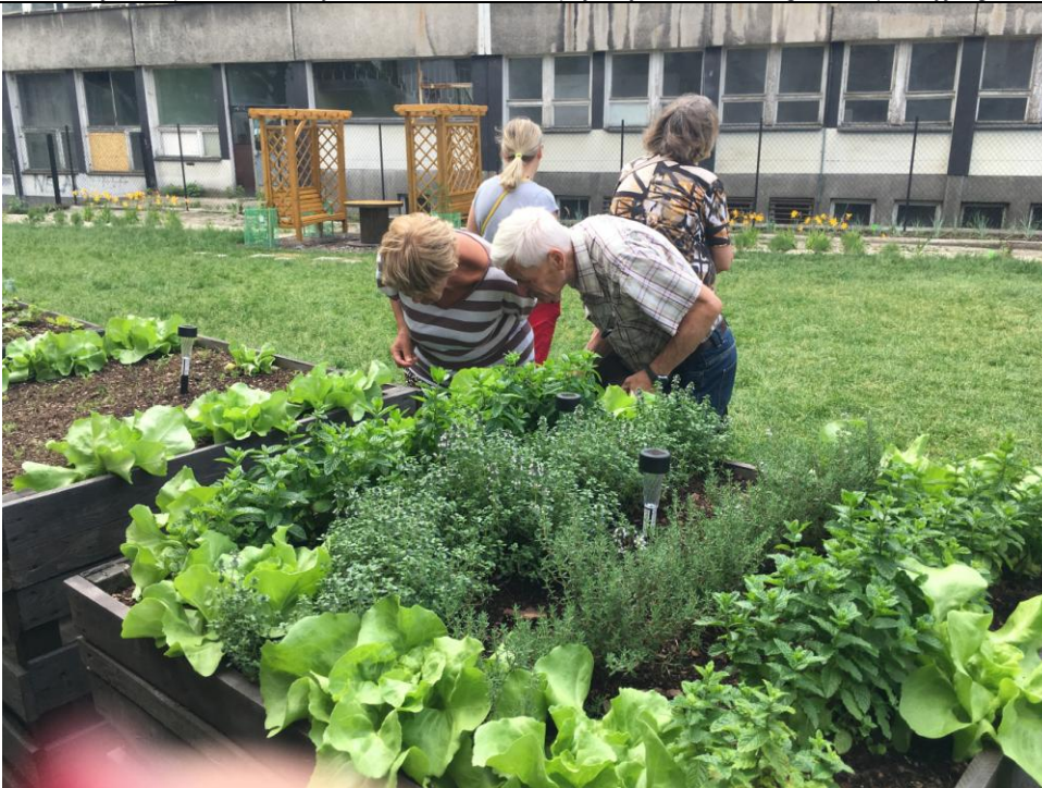
OGRÓD SPOŁECZNOŚCIOWY NA TERENIE FABRYKI PEŁNEJ ŻYCIA

Projekt współfinansowany ze środków Unii Europejskiej w ramach Programu Operacyjnego Pomoc Techniczna 2014-2020