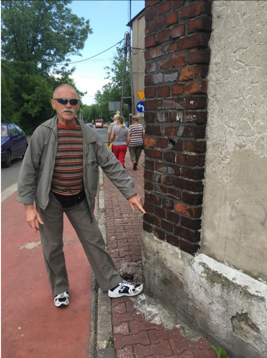
UL. M. KONOPNICKIEJ- jeden z „nieodróżnych” punktów utrudniających przejście pieszym

Projekt współfinansowany ze środków Unii Europejskiej w ramach Programu Operacyjnego Pomoc Techniczna 2014-2020