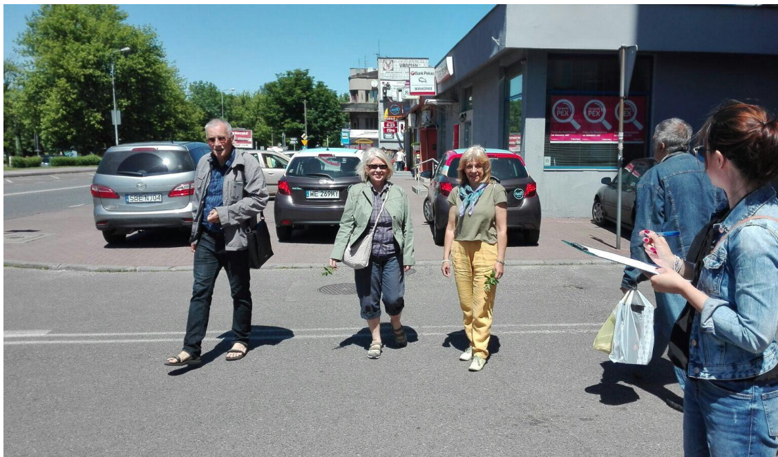
UL. T. KOŚCIUSZKI NA ODCINKU DWORZEC PKP- PRZEJŚCIE PODZIEMNE- jedno z miejsc , gdzie brak oznakowanego przejścia dla pieszych (okolice banku Pekao S.A.)