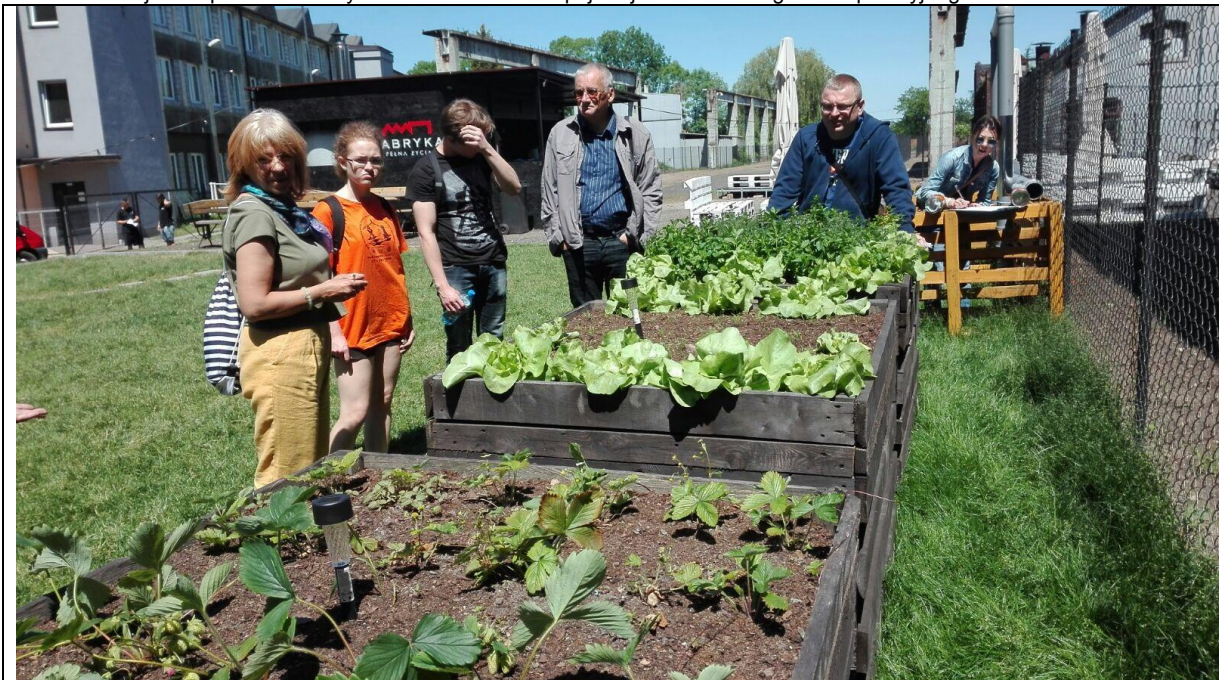
OGRÓD SPOŁECZNOŚCIOWY NA TERENIE FABRYKI PEŁNEJ ŻYCIA

Projekt współfinansowany ze środków Unii Europejskiej w ramach Programu Operacyjnego Pomoc Techniczna 2014-2020