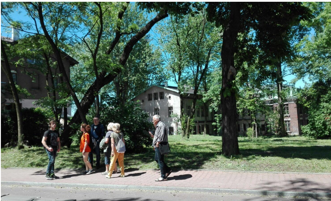
UL. GÓRNICZA PO PRZECIWNEJ STRONIE SKWERU STASZICA

Jako ogromny plus przestrzeni uczestnicy wskazali bardzo ładne jest dojście do Muzeum, szczególnie park na Skwerze Staszica, zachęcający do odpoczynku, cichy, spokojny. Jedna z senierek mówiła: przychodzę tu czasem z wnuczkami , młodzi uczestnicy znają to miejsce, ponieważ przechodzą tędy idąc do szkoły. W opinii uczestników przeciwna strona ulicy mogłaby stanowić kontynuację skweru.